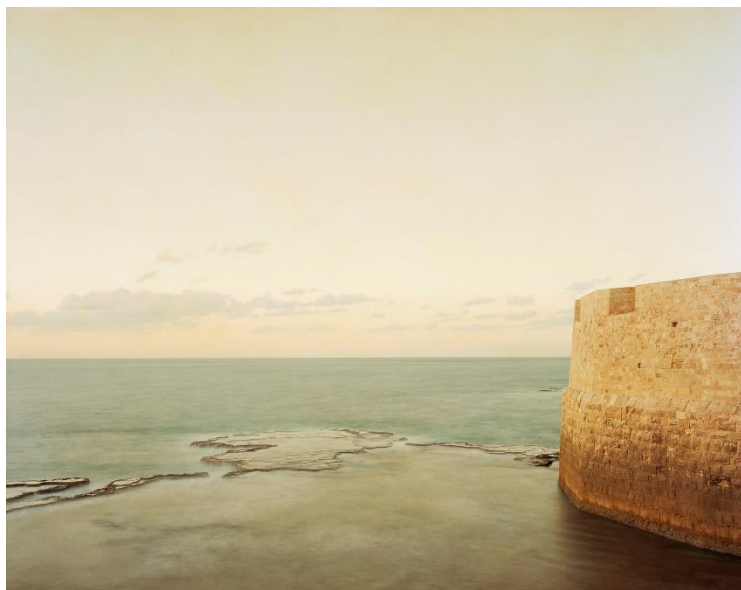
Akko II, Israel 2015