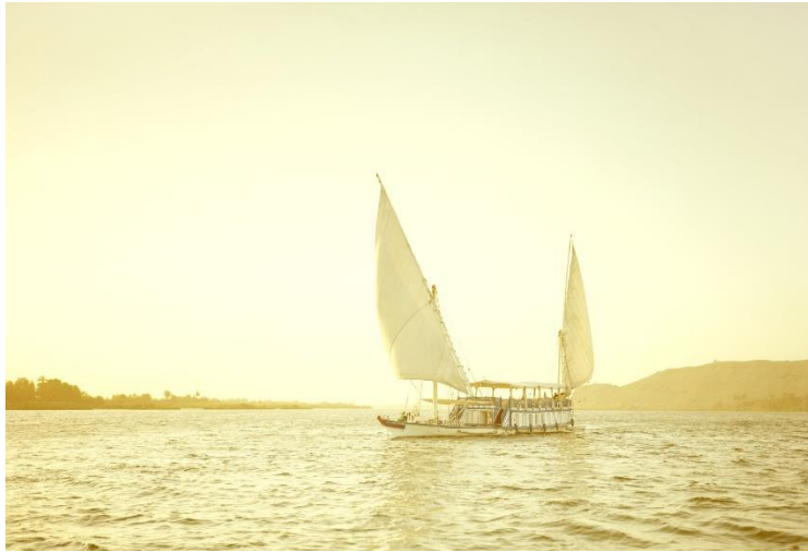
Nil I, Ägypten 2011