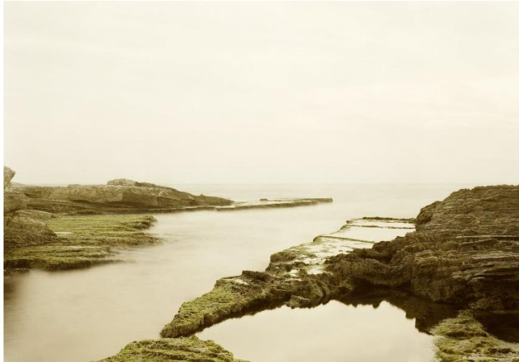
Raouché II, Libanon 2005