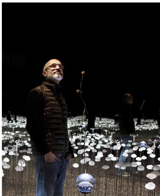
Le Chant des Possibles, installation, 2018, graine de cristal, cristaux, pièce sonore, improvisations sonores : Lilian Bencini, Virginie Fiorello, Rossignon, © Stéphane Guiran

Né en 1968 dans le Var (France), Stéphane Guiran vit et travaille à Eygalières. Formé à l'Essec, grande école de commerce, il quitte, en 2001, le monde du graphisme pour la sculpture.